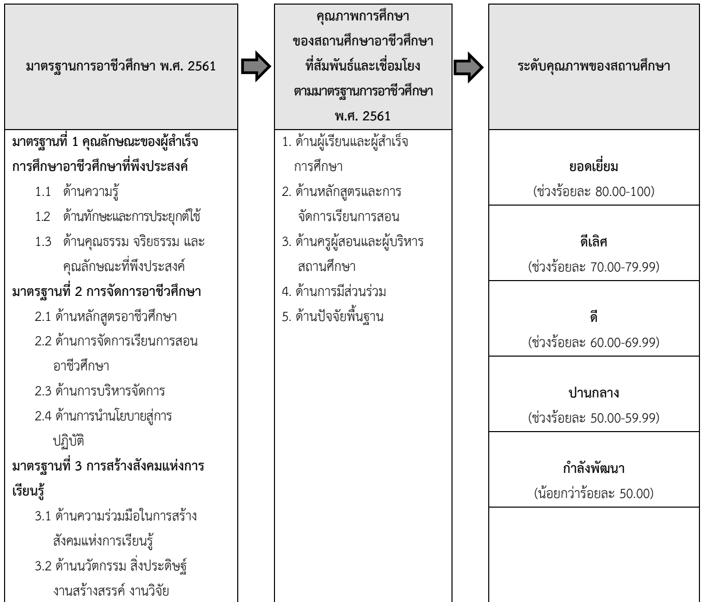
ภาพที่ 1 กรอบแนวคิดการประเมินคุณภาพการศึกษาของสถานศึกษาตามมาตรฐานการอาชีวศึกษา พ.ศ. 2561 ที่สัมพันธ์และเชื่อมโยงกับการประเมินคุณภาพการศึกษาของสถานศึกษาอาชีวศึกษา

ตามมาตรฐานการอาชีวศึกษา พ.ศ. 2561 ประกอบด้วย 3 มาตรฐาน 9 ประเด็นการประเมิน และเกณฑ์การประเมินคุณภาพการศึกษาของสถานศึกษาตามมาตรฐานการอาชีวศึกษา พ.ศ. 2561 ประกอบด้วย 5 ด้าน ได้แก่ ด้านผู้เรียนและผู้สำเร็จการศึกษา ด้านหลักสูตรและการจัดการเรียนการสอน ด้านครูผู้สอนและผู้บริหารสถานศึกษา สามารถนำมากำหนดเป็นกรอบแนวคิดในการประเมินคุณภาพการศึกษาของสถานศึกษา ดังภาพที่ 1